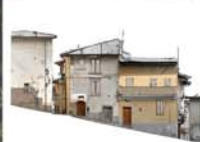
PROSPETTO DA COSTA MASCIARELLI