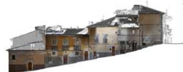
PROSPETTO DA SBRUCCOLO DEI CIUCHI

Mercoledì 13 Febbraio 2013 - Sala del Lapidario - Museo Civico Medievale - Via Porta di Castello n. 3 - Bologna