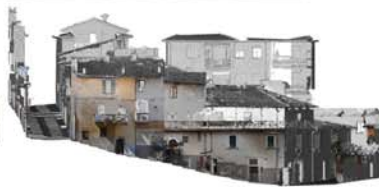
PROSPETTO DA SBRUCCOLO DEI CIUCHI