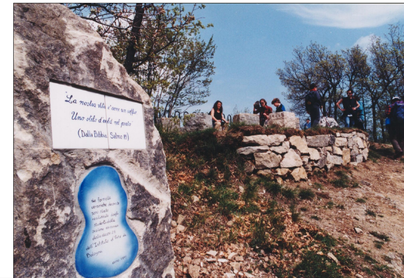
LA NOSTRA VITA E' COME UN SOFFIO UNO STELO DI ERBA NEL PRATO (Bibbia, Salmo 89)

IL PERCORSO ALLA MEMORIA DEI RAGAZZI DEL SALVEMINI, UCCISI DA UN AEREO MILITARE PRECIPITATO SULLA LORO SCUOLA IL 6 dicembre 1990 E' REALIZZATO NEL VERSANTE DI SUD-OVEST DEL MONTOVOLO NEL TRATTO CHE VA DAL SANTUARIO DELLA .....ALLA SOMMITA' DEL MONTE. LO SPUNTO PER IL PROGETTO E' DATO DALLA SPENDIDA PIETRA ARENARIA DORATA DI MONTOVOLO, DALLA FLORA STRAORDINARIAMENTE VARIA DEL LUOGO, IN OGNI STAGIONE, DALLA PREESISTENTE URNA DI SANTA CATERINA DI ALESSANDRIA D'EGITTO POSTA NELL'ORATORIO OMONIMO. TALE URNA IN PIETRA PORTA INCISO UN FIORE E UN ARCOBALENO STILIZZATO. E' STATO ACCOSTATO A CIASCUN RAGAZZO UN FIORE TIPICO DELLA FLORA AUTOCTONA, REALIZZATO SU PIASTRELLA DI CERAMICA DAI RAGAZZI DELLA SCUOLA D'ARTE DI BOLOGNA. LE FORMELLE CERAMICHE SONO FISSATE SU 12 MASSI DISTRIBUITI LUNGO IL PERCORSO. SULLA SOMMITA' DEL MONTE 12 SASSI A FORMA CUBICA DI CIRCA 45 cm DI LATO POSTI IN TONDO ATTORNO AD UN PICCOLO SPAZIO CENTRALE SERVONO A REALIZZARE UNO SPAZIO RACCOLTO. UNA TREDICESIMA PIETRA POSTA IN VISTA PER CHI ARRIVA DALL'ORATORIO DI SANTA CATERINA E' STATA POSTA IN OPERA CON IL LAVORO VOLONTARIO DEL LIONS CLUB DI GRIZZANA MORANDI "CATERINA DE VIGRI". ESSA RIPORTA 10 PIASTRELLE CERAMICHE IN CUI SONO SCRITTE LE MOTIVAZIONI DELLA SCELTA DEI 12 SASSI: 12 SASSI PER FERMARSI, RIPOSARE, RIFLETTERE 12 SASSI PER RICOMPORRE UNA CLASSE VISIBILE DAL CIELO 12 SASSI PER RICORDARE (Giosuè, Cap. 4, ver. 1-9) I 12 RAGAZZI DELL'ISTITUTO SALVEMINI UCCISI DA UN AEREO MILITARE IL 6 dicembre 1990.