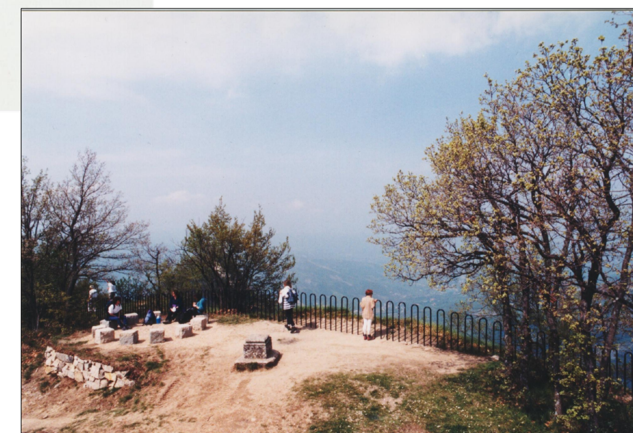
LA SOMMITA' DEL MONTOVOLO CON I 12 SASSI