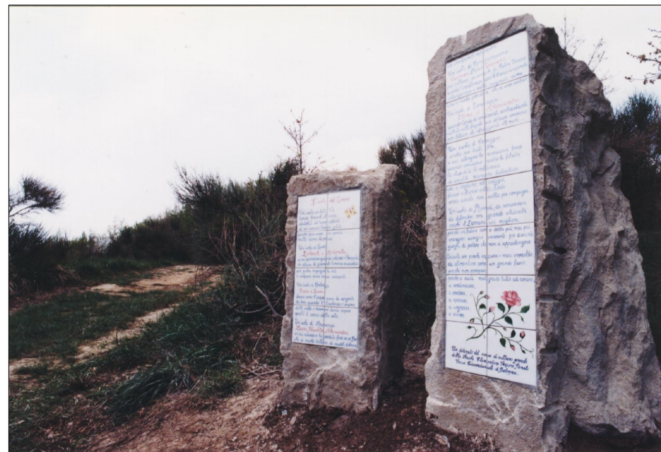
INIZIO DEL PERCORSO

COMUNE DI GRIZZANA MORANDI COMMITTENTE: I GENITORI DEI RAGAZZI DEL SALVEMINI PERCORSO ALLA MEMORIA DEI RAGAZZI DEL SALVEMINI