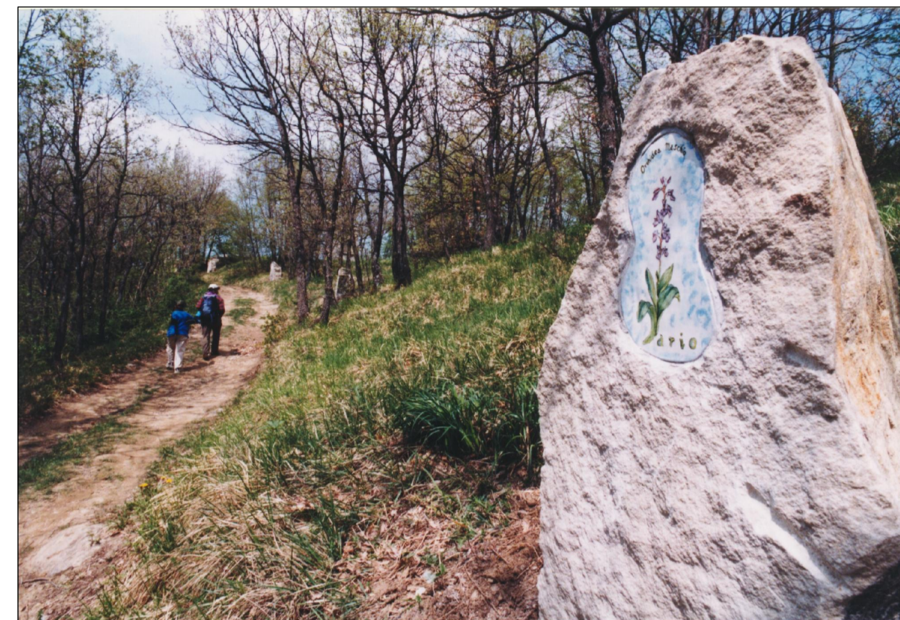
PIETRE COMMEMORATIVE DI CIASCUN RAGAZZO LUNGO IL PERCORSO