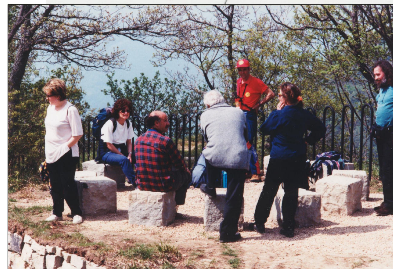
LA FINE DEL PERCORSO CON I 12 SASSI